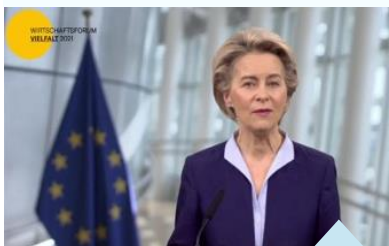
Dr. Ursula von der Leyen , Präsidentin der Europäischen Kommission, im Rahmen des Wirtschaftsforums Vielfalt des Charta der Vielfalt e.V. am Dienstag, den 2. März.