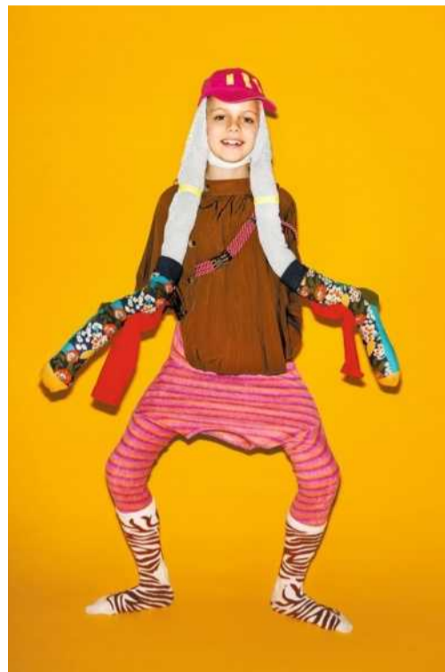
DAS KLAMOTTENMONSTER Ein Pulli als Hose, 'ne Stumpfhose als Haarsatz, der Rock als Cape über den Schultern – fertig!

Der Wirsinghelm hält mit Haarspangen, der Bohnengürtel dank einer Schnur und das Karottenschwert mit Klebeband